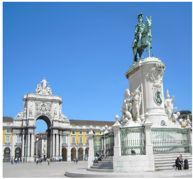
Praça do comércio