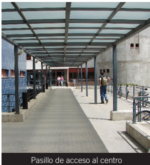
Pasillo de acceso al centro

Líneas: Acceso al Campus de Aynadamar: 6, 9 y 22.